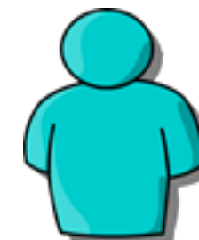
Bygårdeier, Eiendoms- utvikler