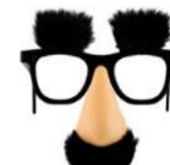
Kommunen Plan og bygg